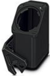
HEAVYCON EVO-Kupplungsgehäuse aus Kunststoff, mit Bajonettflansch für die EVO-Verschraubung, B10, mit Längsbügel, Höhe 90 mm, ohne EVO-Verschraubung

Bitte beachten Sie, dass die hier angegebenen Daten dem Online-Katalog entnommen sind. Die vollständigen Informationen und Daten entnehmen Sie bitte der Anwenderdokumentation. Es gelten die Allgemeinen Nutzungsbedingungen für Internet-Downloads. ( http://phoenixcontact.de/download )