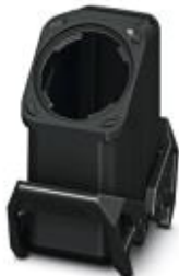
HEAVYCON EVO-Kupplungsgehäuse aus Kunststoff, mit Bajonettflansch für die EVO-Verschraubung, B10, mit Querbügel, Höhe 90 mm, ohne EVO-Verschraubung

Bitte beachten Sie, dass die hier angegebenen Daten dem Online-Katalog entnommen sind. Die vollständigen Informationen und Daten entnehmen Sie bitte der Anwenderdokumentation. Es gelten die Allgemeinen Nutzungsbedingungen für Internet-Downloads. ( http://phoenixcontact.de/download )