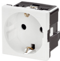
Power - sockets

FrontCom® Vario integriert mehrere Funktionen in nur einem Einfachrahmen. Das System ist einfach zu montieren und Sie können aus unterschiedlichsten Daten-, Signal- und Powermodulen auswählen. FrontCom® Vario ist nicht nur extrem kompakt sondern bietet Ihnen eine Reihe einzigartiger Produktmerkmale, um Ihnen ein sicheres, schnelles und zukunftsorientiertes Projektieren und Arbeiten zu ermöglichen. Außerdem überzeugt das FrontCom® Vario- System durch ein ansprechendes Gehäuse-Design, das nebenbei ausgesprochen schlagfest ist und selbstverständlich die Schutzart IP 65 erfüllt.