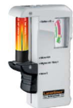
BatteryCheck Verpackungsgröße (B x H x T)