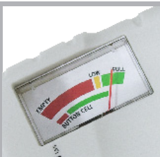
Leicht ablesbare, 3-farbige Skala