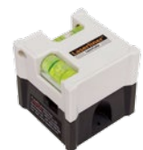
LaserCube + Batterien