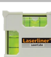
Libellen zum einfachen Ausrichten