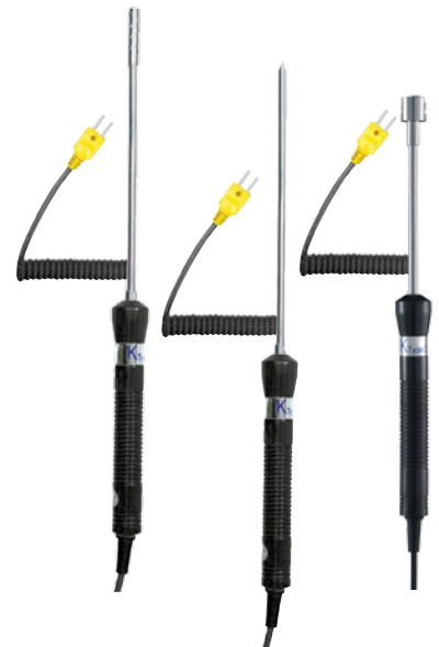
ThermoSensor Air / Tip / Touch + Spiralkabel

Verpackungsgröße (B x H x T) 90 x 400 x 30 mm