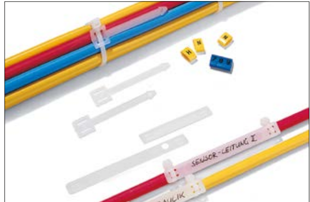
Flexible Kennzeichnung für unterschiedlichste Durchmesser mit AT-Kennzeichnungsplättchen.