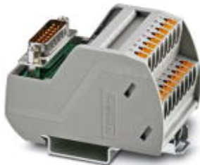
VARIOFACE-Modul, mit Push-in-Anschluss und D-SUB-Miniatur-Buchsenleiste, zur Montage auf NS 35-Tragschienen, Polzahl: 9

Bitte beachten Sie, dass die hier angegebenen Daten dem Online-Katalog entnommen sind. Die vollständigen Informationen und Daten entnehmen Sie bitte der Anwenderdokumentation. Es gelten die Allgemeinen Nutzungsbedingungen für Internet-Downloads. ( http://phoenixcontact.de/download )