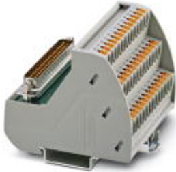
VARIOFACE-Modul, mit Push-in-Anschlüssen und D-SUB-Miniatur-Buchsenleiste, zur Montage auf NS 35-Tragschienen, Polzahl: 37

Bitte beachten Sie, dass die hier angegebenen Daten dem Online-Katalog entnommen sind. Die vollständigen Informationen und Daten entnehmen Sie bitte der Anwenderdokumentation. Es gelten die Allgemeinen Nutzungsbedingungen für Internet-Downloads. ( http://phoenixcontact.de/download )