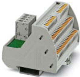
VARIOFACE-Modul, mit zwei Potenzialschienen (P1, P2) zur Potenzialverteilung, zur Montage auf NS 35-Tragschienen. Modulbreite: 97,7 mm

Bitte beachten Sie, dass die hier angegebenen Daten dem Online-Katalog entnommen sind. Die vollständigen Informationen und Daten entnehmen Sie bitte der Anwenderdokumentation. Es gelten die Allgemeinen Nutzungsbedingungen für Internet-Downloads. ( http://phoenixcontact.de/download )