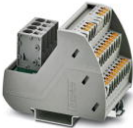
VARIOFACE-Modul, mit Push-in-Anschluss und zwei Potenzialschienen (P1, P2) zur Potenzialverteilung, zur Montage auf NS 35-Tragschienen. Modulbreite: 57,1 mm

Bitte beachten Sie, dass die hier angegebenen Daten dem Online-Katalog entnommen sind. Die vollständigen Informationen und Daten entnehmen Sie bitte der Anwenderdokumentation. Es gelten die Allgemeinen Nutzungsbedingungen für Internet-Downloads. ( http://phoenixcontact.de/download )