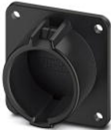
Halterung für Fahrzeug-Ladestecker als Parkposition an Ladestationen (EVSE), Typ 1, SAE J1772

Bitte beachten Sie, dass die hier angegebenen Daten dem Online-Katalog entnommen sind. Die vollständigen Informationen und Daten entnehmen Sie bitte der Anwenderdokumentation. Es gelten die Allgemeinen Nutzungsbedingungen für Internet-Downloads. ( http://phoenixcontact.de/download )