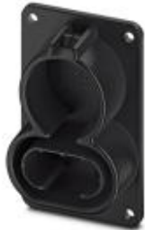
Halterung für Fahrzeug-Ladestecker als Parkposition an Ladestationen (EVSE), CCS Typ 1, SAE J1772

Bitte beachten Sie, dass die hier angegebenen Daten dem Online-Katalog entnommen sind. Die vollständigen Informationen und Daten entnehmen Sie bitte der Anwenderdokumentation. Es gelten die Allgemeinen Nutzungsbedingungen für Internet-Downloads. ( http://phoenixcontact.de/download )