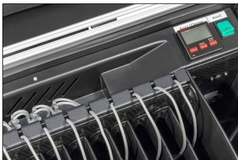
- inkl. Ladetimer