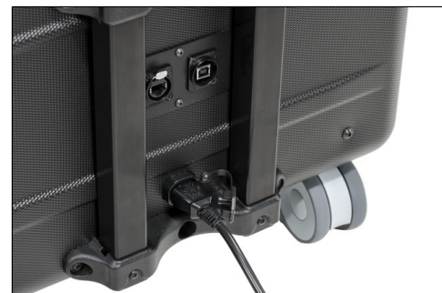
- zentrale Stromversorgung mit Schutzkappe , USB-B-Buchse für die Sync-Funktion , Netzwerkbuchse (RJ45) für Access Point , Optional HDMI-Buchse