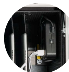
MC10-Multi-Charger für gesamte Stromversorgung der Geräte