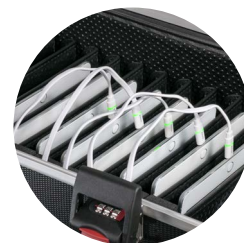
10x Einschubfächer für Tablets