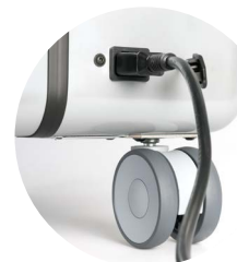
zentrale Stromversorgung mit Schutzkappe