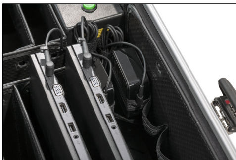
- 10x Staufächer für Laptops