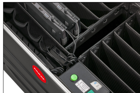
- Ladeinheit (Switch On/Off)