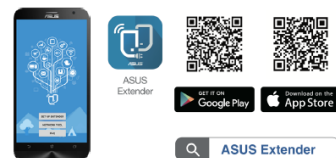
ASUS Extender App

Um die besten Ergebnisse zu erzielen muss sich der RP-AC55 innerhalb der Reichweite eines stabilen Router-Signals befinden und sollte zwischen dem Router und dem Bereich platziert werden, in dem eine bessere Signalabdeckung benötigt wird. Der Asus RP-AC55 bietet die höchste Performance, wenn er ein starkes WLAN-Signal vom Router erhält und dieses weiterleitet. Die Signalstärke kann an der Frontseite des Repeaters getrennt nach Frequenzband abgelesen werden.