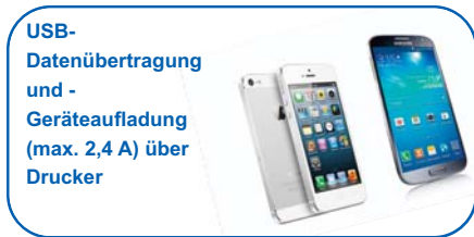
USB-Datenübertragung und -Geräteaufladung (max. 2,4 A) über Drucker