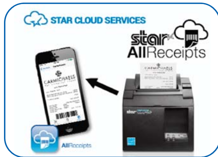
STAR CLOUD SERVICES star AllReceipts

Der neue TSP143III USB funktioniert reibungslos mit dem neuen digitalen Belegservice AllReceipts von Star. Der Drucker lädt umgehend ein Bild des gedruckten Belegs (mit farbigem Werbebild oder allgemeinen Geschäftsbedingungen) zur Cloud hoch, wo es der Kunde anonym abrufen kann – es ist keine Telefonnummer oder E-Mail-Adresse erforderlich. Einzelhändler sind nun in der Lage, umgehend Feedback bezüglich der Kundenzufriedenheit zu erhalten und Werbematerial auf dem Smartphone des Kunden zu präsentieren. Der Kunde wiederum verfügt über eine neue mobile App zur digitalen Verwaltung seiner Belege nach Datum, Typ oder Einzelhändler, inklusive Backup- und Druckmöglichkeit. Die Online-Geräteverwaltung in Echtzeit ist ebenfalls im Lieferumfang enthalten. www.Star-EMEA.com/products/starcloudservices