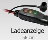
Ladeanzeige 56 cm