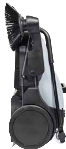
Der Kehrgutbehälter bleibt an Ort und Stelle, auch wenn die Kehrmaschine in einer aufrechten Position aufbewahrt oder an die Wand gehängt wird.