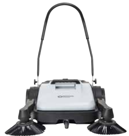
SW200 mit einem Seitenbesen und SW250 mit zwei Seitenbesen bieten Arbeitsbreiten von 70 cm bzw. 90 cm.