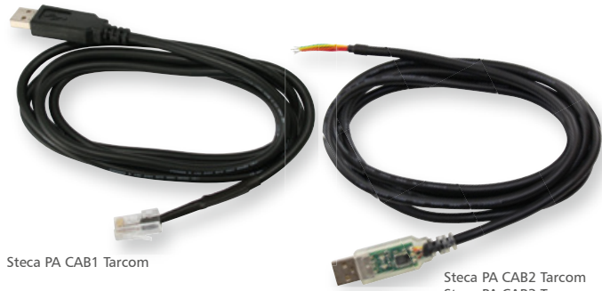
Steca PA CAB1 Tarcom