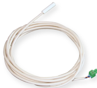
Steca PA TS-S

Die externen Temperatursensoren Steca PA TS10, Steca PA TS20IP10 und Steca PA TS-S dienen der Überwachung der Batterietemperatur. Alle Steca Solarladeregler sind mit einem integrierten Temperatursensor ausgestattet und damit in der Lage, die Ladestrategie immer den momentanen Temperaturbedingungen anzupassen. Die externen Temperatursensoren werden nur benötigt, wenn die Batterie in einem anderen Raum aufgestellt werden muss als der Solarladeregler. Steca PA TS10 wird mit einem Kabel inklusive Stecker für den Anschluss am Solarladeregler und einer Ringöse zum Anschluss an der Batterieschraube geliefert. Der Steca PA TS20IP10 wird entsprechend mit Steckern und Ringöse geliefert, sodass ein frei wählbares Kabel verwendet werden kann. Die externen Temperatursensoren sind geeignet für die Solarladeregler Steca PR 10-30, Steca Solarix, Steca Solarix MPPT, Steca Power Tarom, Steca PR 2020 IP, Steca Tarom 4545/4545-48 und Steca Tarom MPPT 6000-S/6000-M.