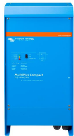
MultiPlus Compact 12/2000/80

Außerdem steht auch noch hoch entwickelte Software (VE.Bus Schnellkonfiguration und VE.Bus System Konfiguration) zur Verfügung, um einige neue, erweiterte Funktionen zu konfigurieren.