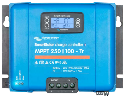
Solar-Laderegler MPPT 250/100-Tr mit einsteckbarem Display

Gleicht Konstant- und Ladeerhaltungsspannungen nach Temperatur aus.