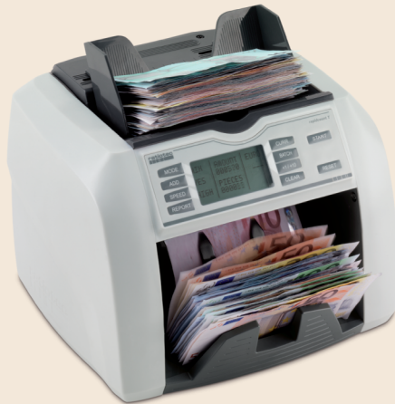
rapidcount T 275