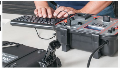
Drei separate USB-Schnittstellen zum gleichzeitigen Anschluss an PC und Eingabegeräten wie USB-Tastatur, USB-Barcodescanner, USB-Speicher oder Bluetooth Geräte mit USB-Dongle (optional)