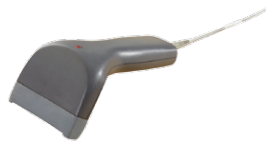
BC-1250G, schwarz Barcode-Scanner inkl. USB-Kabel