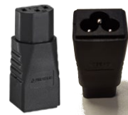
PA-1 Adapter Kaltgeräte auf Klebblatt (IEC C6-C13)