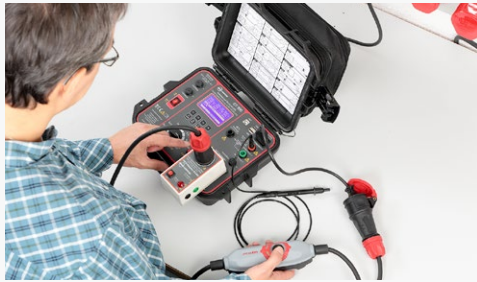
Prüfung von ortsveränderlichen Fehlerstrom-Schutzschaltern (PRCD, PRCD-S, PRCD-S+, PRCD-K) (nur GT-900).