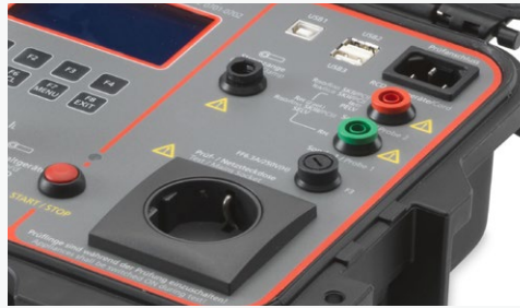
Anschluss für externen Stromzangenadapter (optional Beha-Amprobe CHB 1) zur Messung von Schutzleiterströmen auch an 3-phasigen Prüflingen (nur GT-900).