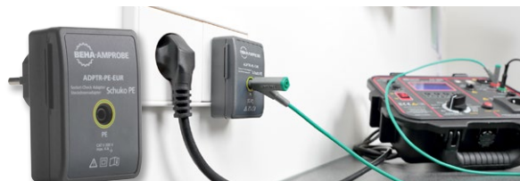
ADPTR-PE-EUR Socket Check Adapter Schuko PE