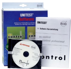
0701/0702/0113 Software es control professional

Gerätetester für Prüfungen nach SNR 462638 und electrosuisse info 3024 d mit schweizer Netz-kabel (Typ 12) und Prüf-/Netzsteckdose (Typ 23).