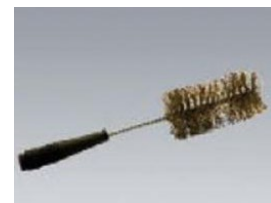
PAT-BRUSH Bürstensonde 4 mm Stecktechnik