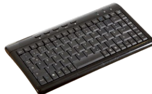
KBGE-MT2045 USB Tastatur