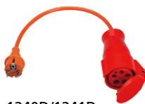
1240D/1241D Drehstromadapter 16 A CEE 5-polig 1240D 32 A CEE 5-polig 1241D