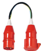
1235D/1236D Messadapter CEE 5-polig 16 A 1235D CEE 5-polig 32 A 1236D