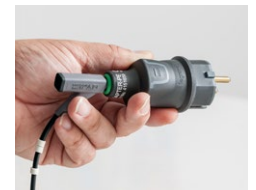
Adapter-PE für Schutzleiter