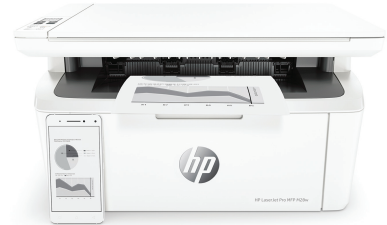
HP LaserJet Pro MFP M28w Drucker