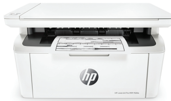
HP LaserJet Pro MFP M28a Drucker

Produktivität mit einem MFP, der zu Ihrem Platzbedarf und Budget passt. Drucken, scannen, kopieren und erzeugen Sie Druckergebnisse in Profiqualität. Einfaches Drucken und Scannen über Ihr Smartphone. 2,3