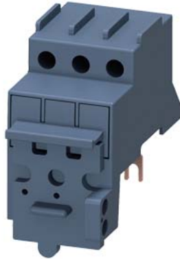
Trennerbaustein für Leistungsschalter Baugröße S00/S0