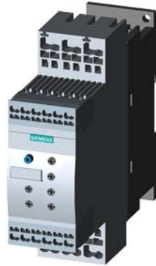
SIRIUS Sanftstarter S0 25 A, 11 kW/400 V, 40 °C AC 200-480 V, AC/DC 110-230 V Federzugklemmen