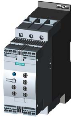
SIRIUS Sanftstarter S2 45 A, 30 kW/500 V, 40 °C AC 400-600 V, AC/DC 24 V Federzugklemmen