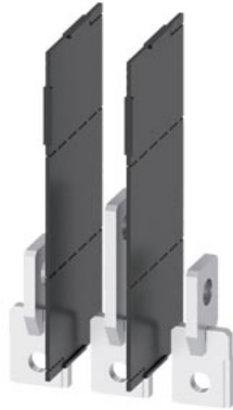
Anschlussverlängerung hochkant 3 Stück Zubehör für: 3VA1 250