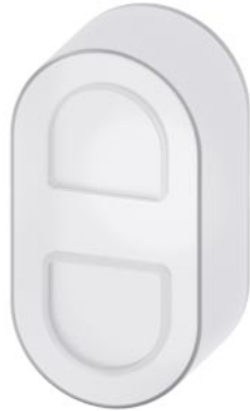
Silikonfreie Schutzkappe für Doppeldrucktaster hoch, klar