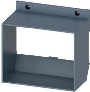
Türdurchführung Zubehör für: Leistungsschalter, 3-/4-polig 3VA1 250