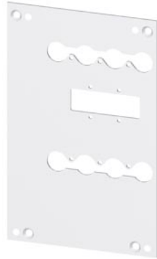
Rückseitige Verriegelung Montage Platte Zubehör für: 3VA1 250