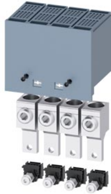
Rundleiteranschlussklemme groß 4 Stück Zubehör für: 3VA1 100/160