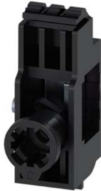
Adapter Zylinderschloss Zubehörfach Zubehör für: 3VA1 160