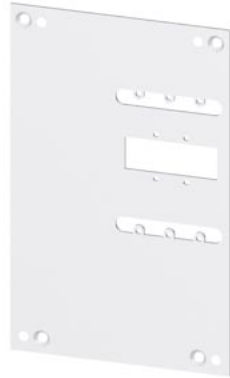
Rückseitige Verriegelung Montage Platte Zubehör für: 3VA1 160