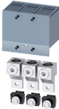
Rundleiteranschlussklemme groß 3 Stück Zubehör für: 3VA1 250