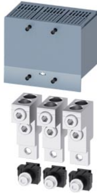
Rundleiteranschlussklemme 2 Kabel 3 Stück Zubehör für: 3VA1 250