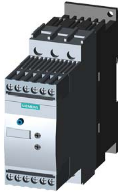
SIRIUS Sanftstarter S0 25 A, 11 kW/400 V, 40 °C AC 200-480 V, AC/DC 24 V Schraubklemmen