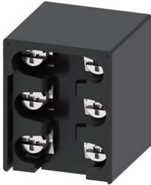
Schaltelement für Positionsschalter 3SE51/52 1S/2Ö Schleickkontakt