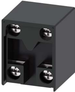
Schaltelement für Positionsschalter 3SE51/52 1S/1Ö Sprungkontakt Kurzhub