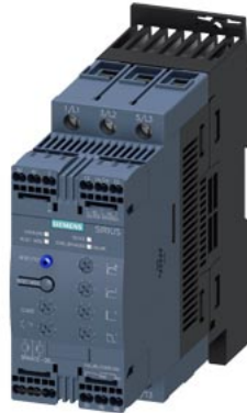
SIRIUS Sanftstarter S2 63 A, 37 kW/500 V, 40 °C AC 400-600 V, AC/DC 110-230 V Federzugklemmen