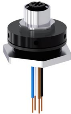
Adapter M12-Buchse, 4-polig, zur M25 Kabeleinführung, für Kunststoffgehäuse