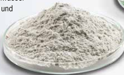
Aus dem gemahlene Glas wird das Granulat geformt

Extover® wird nach einem speziellen, selbstentwickelten Verfahren hergestellt. Zuerst wird Recyclingglas fein gemahlen, gemischt und geformt. Im Drehrohrfö- fen wird das Rohkorn anschließend expandiert. Dieser Prozess erzeugt leichte druckfeste Körner mit einer feinen Porenstruktur.