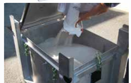
Beispiel eines brandsicheren ASP-Gefahrgutbehälters zur Beförderung beschädigter Lithium-Batterien.