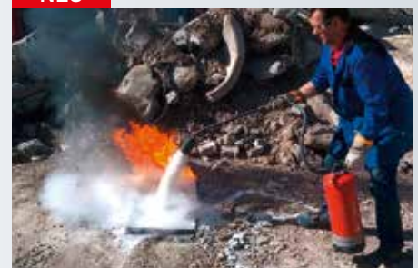
Löschen eines Benzin-Diesel-Petroleum-Gemisches mit einem Metallbrandlöscher befüllt mit Extover® 0,1-0,3 mm.