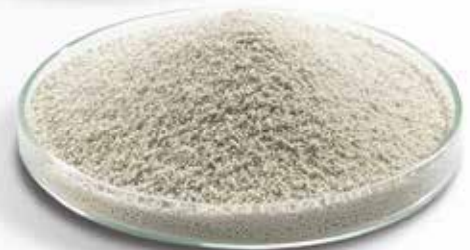
Das finale Produkt: Extover®