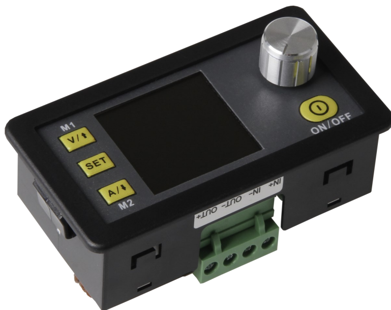
DPS5005 Programmierbares Netzteil