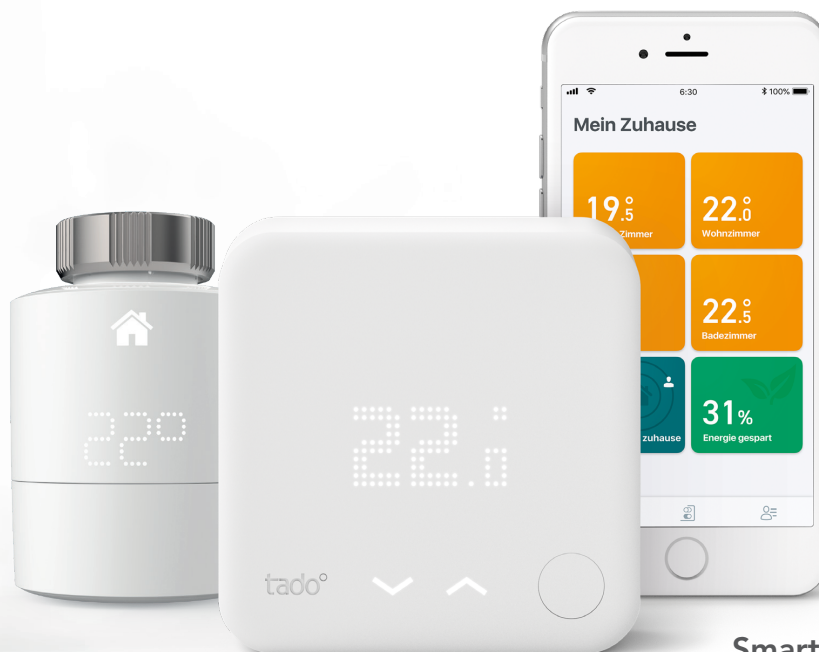
Smarte Thermostate V3+