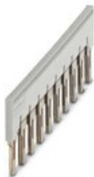
Steckbrücke, Rastermaß: 8,2 mm, Farbe: grau

Bitte beachten Sie, dass die hier angegebenen Daten dem Online-Katalog entnommen sind. Die vollständigen Informationen und Daten entnehmen Sie bitte der Anwenderdokumentation. Es gelten die Allgemeinen Nutzungsbedingungen für Internet-Downloads. ( http://phoenixcontact.de/download )