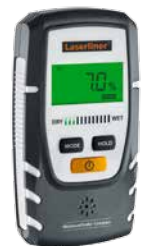
MoistureFinder Compact + Batterie