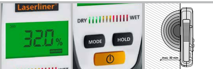
Großes, übersichtliches LC-Display