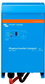
Phoenix Inverter Compact 24/1600

Die Möglichkeiten mit parallel geschalteten Wechselrichtern sind tatsächlich erstaunlich. Vorschläge, Beispiele und Kapazitätsberechnungen können Sie in unserem Buch "Immer Strom" nachlesen. (Kostenfrei erhältlich bei Victron Energy und herunterladbar von www.victronenergy.com ).