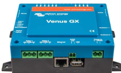
Venus GX Vorderansicht