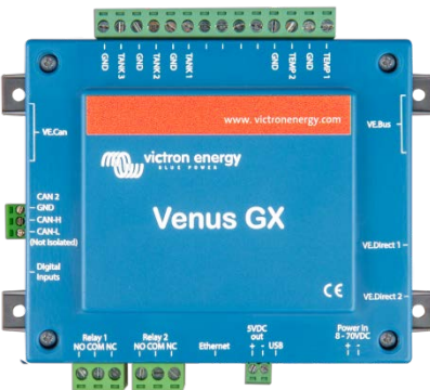
Venus GX mit Steckern